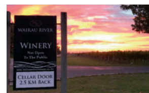
Neuseeland Gregor unterwegs