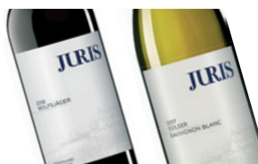
Neue Ausstattung Unsere Etiketten