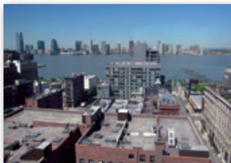
New York City