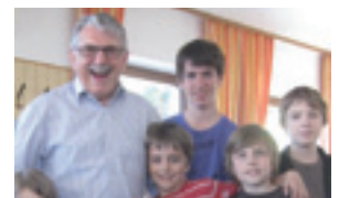
70 Jahre ist es her.