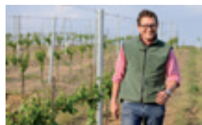
Bekenntnis zu einer Leidenschaft