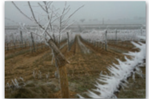
Im November wurden -21°C im Seewinkel gemessen.

Das Wetter in dieser Zeit war windig, kalt und feucht. Dementsprechend niedrig war auch der Fruchtansatz. Während des Sommers bestand ein hoher Infektionsdruck durch das labile Wetter. Erst im September beruhigte sich die Situation und die Trauben konnten bei trockenem warmen Wetter ausreifen und geerntet werden.