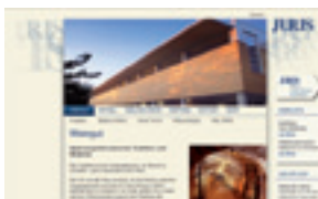
Neue Website und Online-Shop